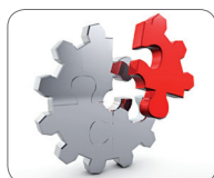
Integration: Outlook®, Project®, SharePoint®