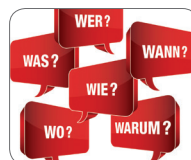
Aufgaben- und Ressourcen-Management