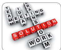
Brainstormings und Recherche