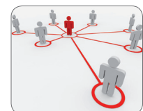
Kollaboration jederzeit und überall

Entdecken Sie weitere Möglichkeiten für sich und Ihr Team, mit MindManager Ihre Projekte zu planen und Projektteams zu managen.